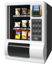
冷凍自動販売機「ど冷えもん」シリーズ(一部)