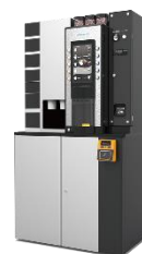
ミルク付きコーヒーマシン VS-CRYSTA