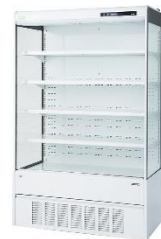
リサイクル・ショーケース