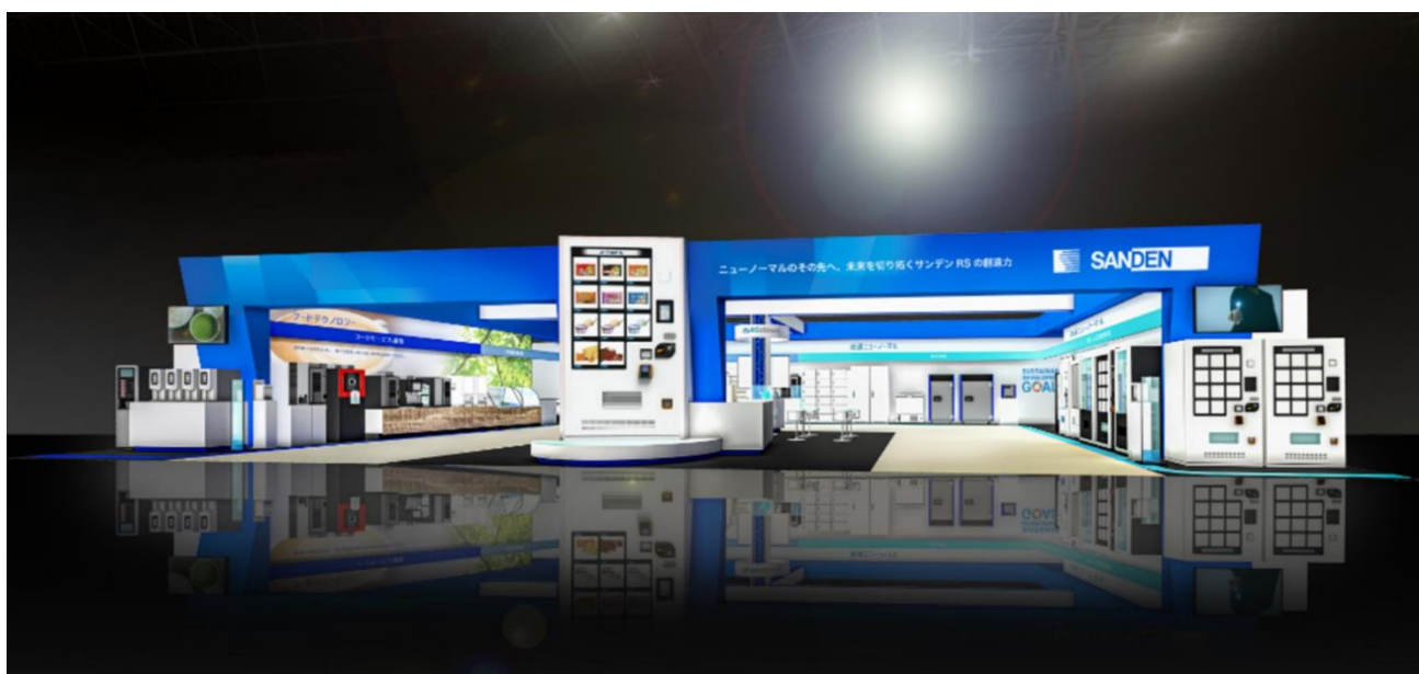
「スーパーマーケット・トレードショー2022」展示スペースイメージ図 ※正面中央は現在話題の冷凍自動販売機「ど冷えもん」の設置活用事例を大型スクリーンにて表示

スーパーマーケット・トレードショー2022に出展 テーマ「ニューノーマルのその先へ、未来を切り拓くサンデンRSの創造力」