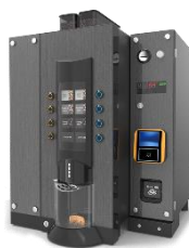
ドリップ式コーヒーマシン CRYSTA II