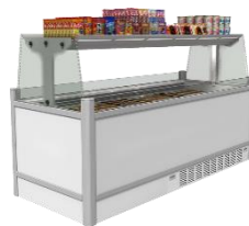
ノンフロン・ショーケース