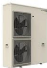
CO 2 ノンフロン冷凍機

カーボンニュートラルゾーンでは、脱炭素社会の実現に向けて、ノンフロンや低 GWP ※1 冷媒を利用した内蔵・別置タイプの「冷凍冷蔵ショーケース」および店舗スタッフの労力や手間の軽減を目指した様々な省力化・省人化を実現する機器の展示をします。また、資源を繰り返し有効活用するためにショーケースの新たなリユース・リサイクルの仕組みも提案しています。