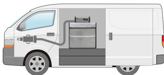
＜アクセサリソケットから「レボクール・キューブ」へ電源供給している例＞

また電源としては、車のアクセサリソケット ※2 に専用プラグを挿入する方法の他、市販のポータブルバッテリーも使用可能です。さらにエンジンを停止している場合にポータブルバッテリーを組み合わせることで、より長時間安定的に温度を保つことが可能となります。