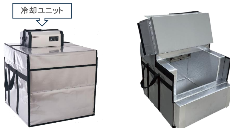
上扉を開けた際の高さ: 1020 mm

今回発売する「レボクール・キューブ」は、冷凍・冷蔵の温度保持機能が高く、しかも商用バンなどの小型サイズの車両に積み込むことを可能にする目的で開発。既に大型運搬用トラックに対応する可動式保冷库「REVOCOOL レボクール」を販売し、運搬中の食品や医薬品等の鮮度保持に大きな役割を果たしていますが、より小回りの効く商用バン等に車載可能な冷凍・冷蔵ボックスへの要望に応える形で、より小型で軽量の「レボクール・キューブ」を開発しました。