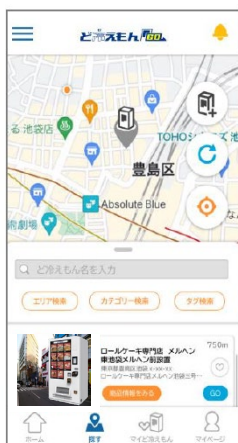
ページにアクセス