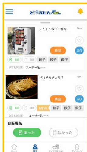
＜「あった」「なかった」ボタンの新設＞

「ど冷えもん GO」の地図上に「あった」「なかった」のボタンを新設します。基本的に「ど冷えもん」を移設する場合には、新たな設置場所に修正する仕組みとなっています。「ど冷えもん GO」への反映の遅れなどがあった場合、ユーザーの方々からの情報が、最新かつ正しい情報の掲載に繋がります。さらにユーザー参加型ならではの、楽しみながら双方向の情報共有による「ど冷えもん GO」のさらなる充実が実現できるものと考えます。