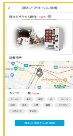
販売商品のカテゴリ選択