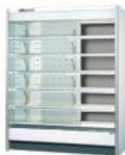
ハイブリットショーケース