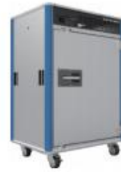
RevoCool (移動式定温保管庫) 【参考出展】

今後もサンデン RS は、「省エネ」「省力化」「省人化」の 3 省の課題解決に積極的に取り組むと共に、新たな業態およびサービスの提案を広く行っていくことで、利便性に富んだ快適な流通システムを作り上げていきます。