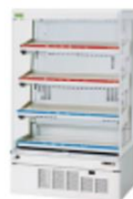
ノンフロンショーケース