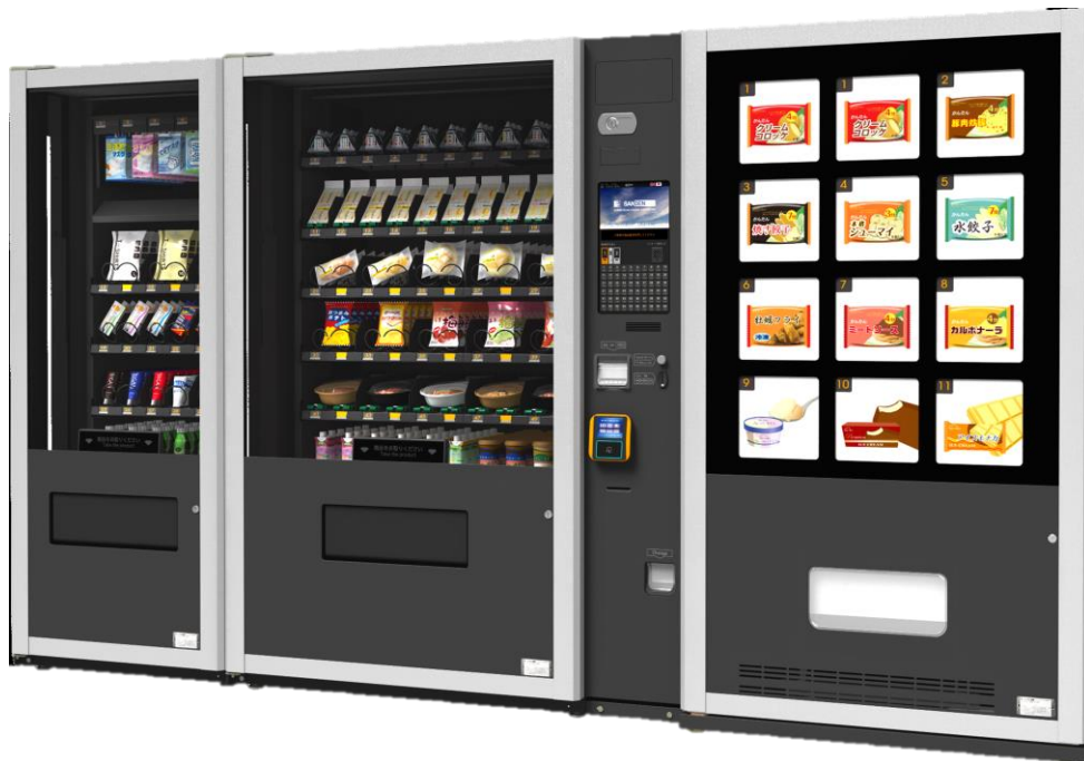
3つの機能を持つ新発売の自動販売機 高機能自動販売機「MMV」に冷凍自動販売機「ど冷えもん」を連結

サンデン・リテールシステム株式会社(本社:東京都 代表取締役社長:森 益哉、以下サンデンRS)は、2021年6月30日(水)から、高機能自動販売機「MMV マルチ・モジュール・ベンダー」に冷凍自動販売機「ど ひ 冷えもん」を連結した、今までにない全く新しいタイプの自動販売機の販売を開始します。今回発売する新しいタイプの自動販売機は、常温(20℃)・冷蔵(5℃)・冷凍の3つの温度帯で商品の販売が可能となります。これにより非接触・非対応での買い物が加速され、消費者の方々の利便性が向上するものと思われます。