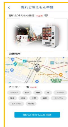
販売商品のカテゴリ選択