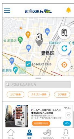
ページにアクセス