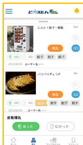
＜「あった」「なかった」ボタンの新設＞

「ど冷えもん GO」の地図上に「あった」「なかった」のボタンを新設します。基本的に「ど冷えもん」を移設する場合には、新たな設置場所に修正する仕組みとなっています。「ど冷えもん GO」への反映の遅れなどがあった場合、ユーザーの方々からの情報が、最新かつ正しい情報の掲載に繋がります。さらにユーザー参加型ならではの、楽しみながら双方向の情報共有による「ど冷えもん GO」のさらなる充実が実現できるものと考えます。