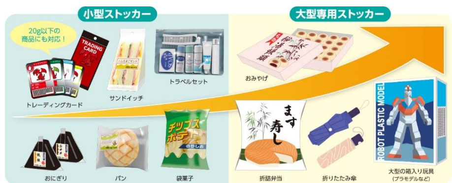
「ど冷えもん MULTI」新機種6セレクションタイプで販売できる主な商品